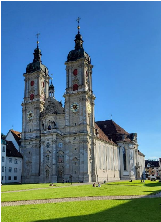
Klosterkirche St. Gallen

An das Evang. Bildungswerk Donau-Ries e.V. Würzburger Str. 13 86720 Nördlingen